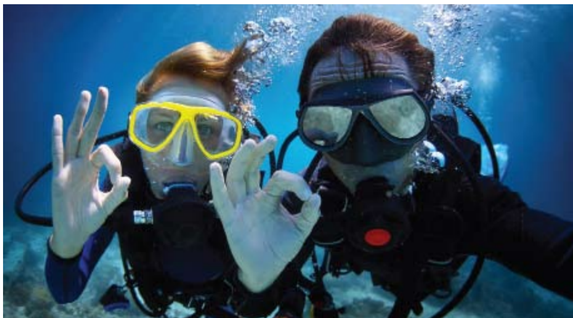
Las personas que practican buceo deben recurrir a tratamientos aplicados por un profesional.

Desde hace 10 años estoy realizando tratamientos de las vegetaciones y anginas mediante una técnica llamada coblación (término procedente de dos palabras anglosajonas: 'cold ablation', que significa: 'ablación en frío'). Se trata