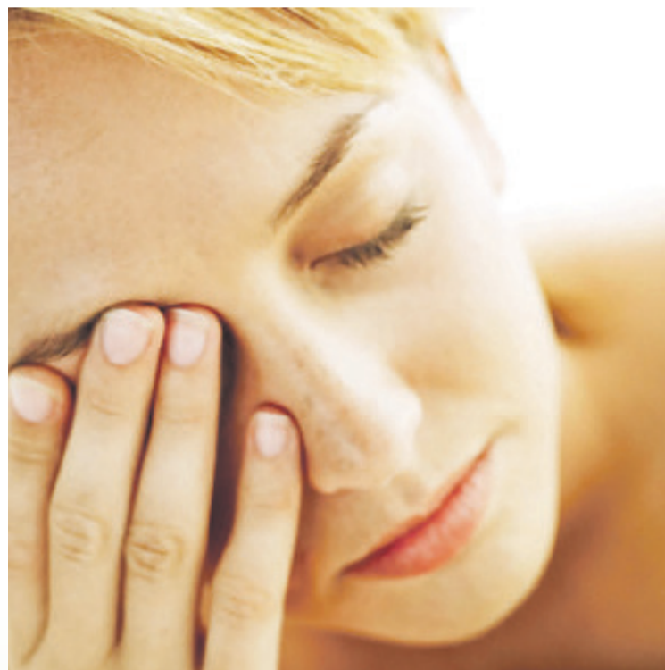
Con la edad es más probable que aparezcan las ojeras

Socialmente, las ojeras se suelen asociar con cansancio, enfermedad o preocupación, pero más